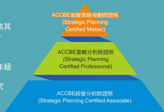
ACCBE策略規劃師系列證照示意圖